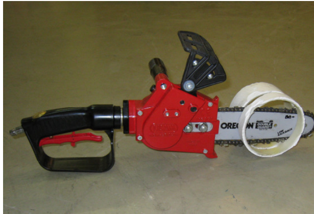
Klein und handlich...