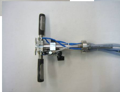
... Steuer-Griff für Midi und Mini !