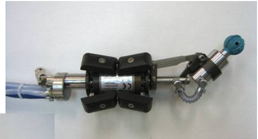
... sein kleiner Bruder Mini...