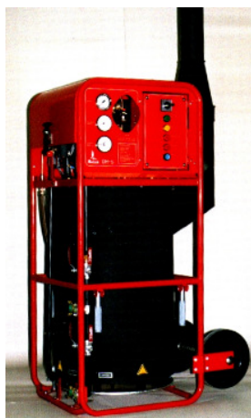
Die mobile Diesel-Heizanlage...

Warmaushärtung für gesicherte Qualität !